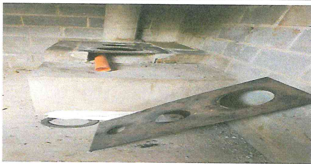
Foto1: en proceso el cambio de plancha de metal de3 hornillas.