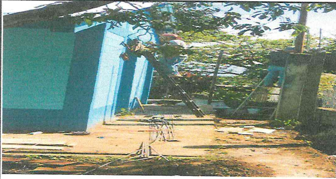
Foto1: En proceso de la construccion de la base para el tinaco.